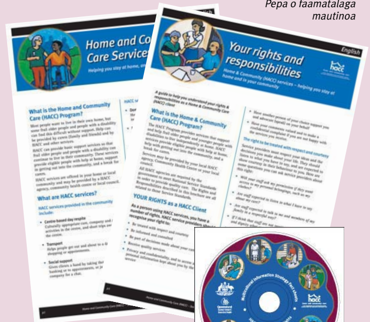
Pepa o faamatalaga maunitoa

O pepa o ata faapipii o atunuu eseese a le HACC (pepa A2 ua naunau faalapoia i le pepa A4) e mafai foi ona maua mai i le Unaiite o Punavai.