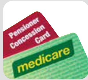
کارت مدیکر / تخفیف concession card/Medicare