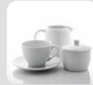
چای / قهوه tea/coffee