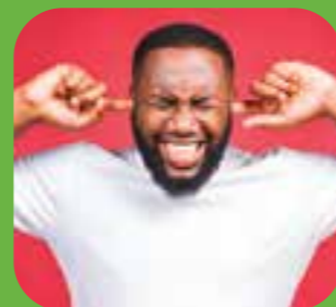
خیلی بلند too loud