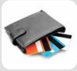
کیف پول / کیف پول زنانه wallet/purse