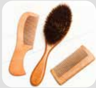
برس / شانه comb/brush