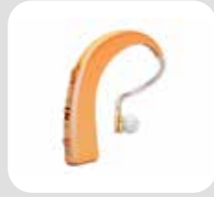
سمعک hearing aid