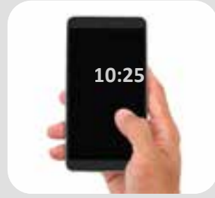
تلفن همراه mobile phone