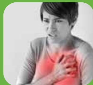
درد قفسه سینه chest pain