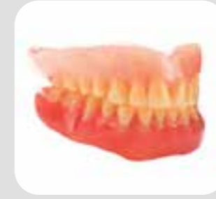
دندان مصنوعی dentures