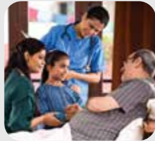
ဟံာ်ဖိယိဖိ family

When you need an interpreter, point to this picture and staff will provide you with one at no cost to you.