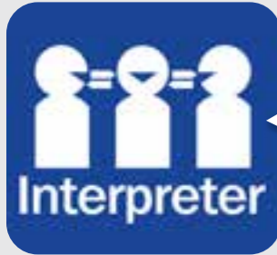
ပုကတိကျိးထံတင် interpreter

ဖဲနမုာ်လိာ်ဘာ်ပုကတိကျိးထံတင်အခါဒူးနဲာ်ဘာ်တင်ဂါတခါအါဒီးပုမတဖိကဟ့ာ်နဒီးပုကတိကျိးထံတင်တဂါလတလိာ်ဟ့ာ်အပူဘာ်န့ာ်လိာ်.