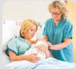
သရံာ်မုာ်ဒူးအိာ်ဖျဲာ်ဖိ midwife