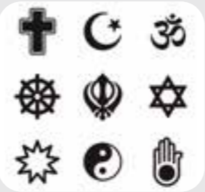
တင်ဘူာ်တင်ဘါအတင်ဆိာ်ထွဲ religious support