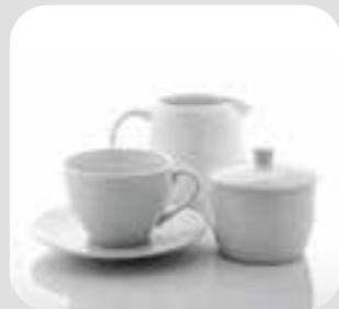
ခီဖံန်, လန်ဖးထံ coffee/tea