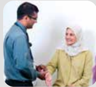
ကသံာ်သရံာ် doctor