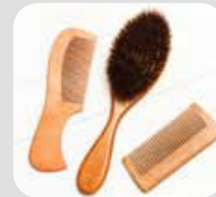
သံန်, သံန်ခွံခိန်သု brush/comb