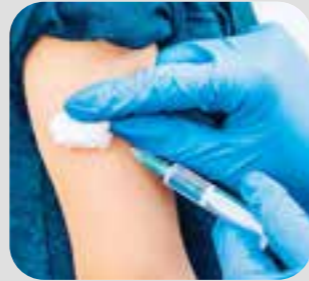
ကသံာ်ဆဲး injection