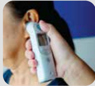
တင်ကိာ်တင်ခုာ် temperature