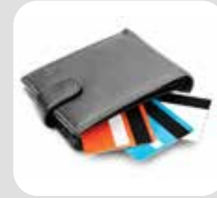
စုဒါ, စုထာန် wallet/purse