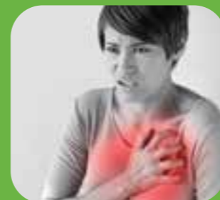
သးနုပုင်ဆါ chest pain