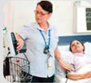
သရံာ်သရံာ်မုာ်ကွာ်ထွဲပုဆါ nurse