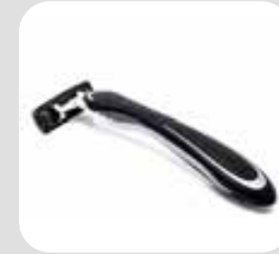
ဒီလူတင်အဆုန် razor