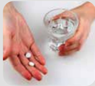
ကသံာ်ကသိ medicine