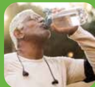
သးအူလါထံ thirsty