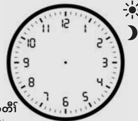
တင်ဆါကတိာ် time