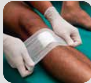
တင်ပူလိာ် wound