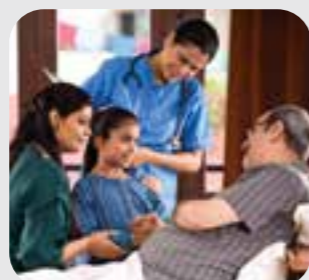
gia đình family

When you need an interpreter, point to this picture and staff will provide you with one at no cost to you.