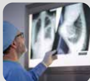
soi x-quang x-ray