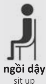
ngồi dậy sit up