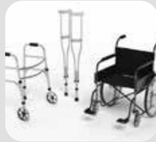
trợ cụ di chuyển mobility aid