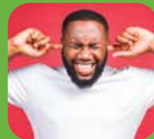
quá to too loud