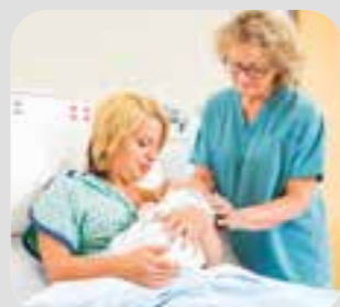
nữ hộ sinh midwife