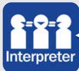
thông dịch viên interpreter

Khi quý vị cần thông dịch viên, hãy chỉ vào hình này và nhân viên sẽ cung cấp thông dịch viên miễn phí cho quý vị.