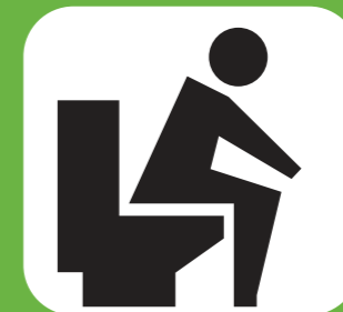
tiêu chảy diarrhoea