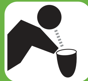
nôn mửa vomiting