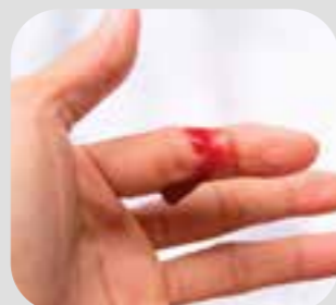
chảy máu bleeding