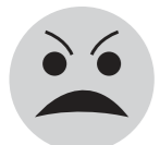
tức giận angry