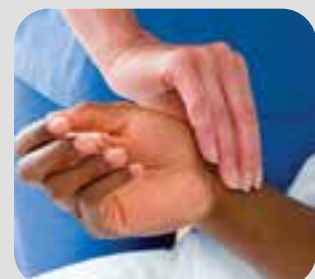
nhịp tim mạch pulse