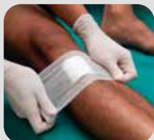
vết thương wound