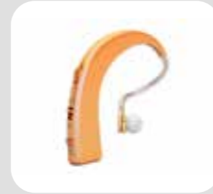
máy trợ thính hearing aid