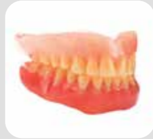
răng giả dentures