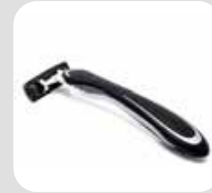
dao cạo râu razor