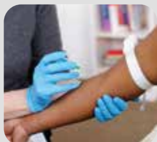
xét nghiệm máu blood test