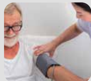
áp huyết blood pressure