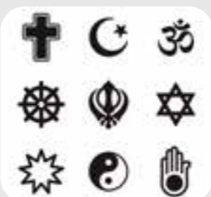
hỗ trợ tín ngưỡng religious support