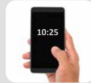
điện thoại di động mobile phone