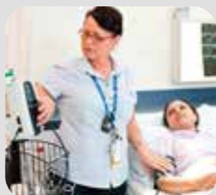
y tá nurse