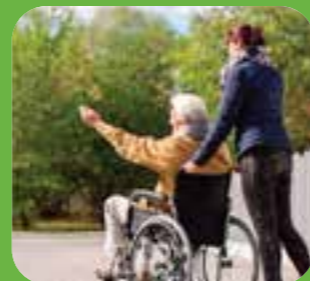
ra bên ngoài go outside