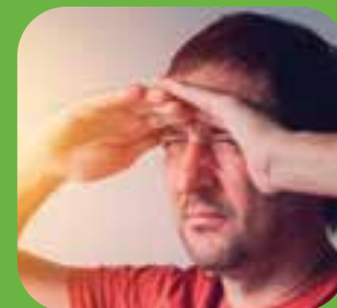
quá chói too bright