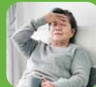
nhức đầu headache