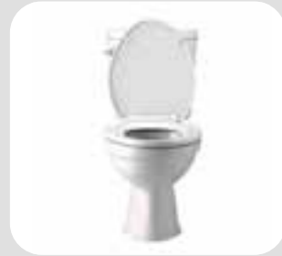
phòng vệ sinh toilet