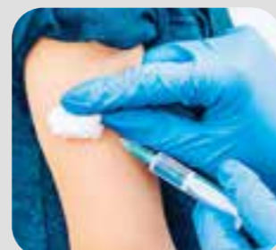
tiêm chích injection