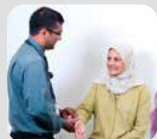
bác sĩ doctor