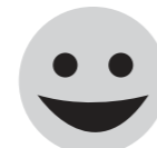
hứng khởi excited