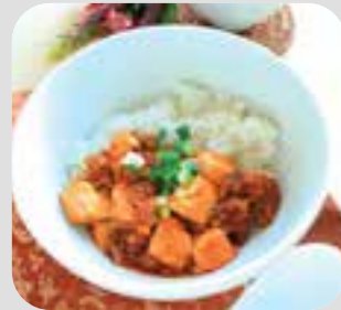
thức ăn food