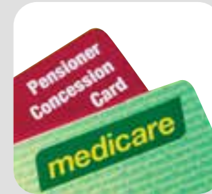
thẻ Medicare/ chức giảm Medicare/concession card