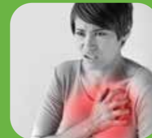
đau ngực chest pain