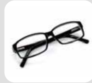
kiếng mang glasses