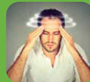
chóng mặt dizzy