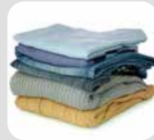
quần áo clothes