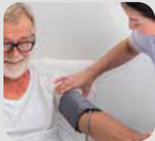
သွေးပေါင်ချိန် blood pressure