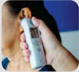
အပူချိန် temperature