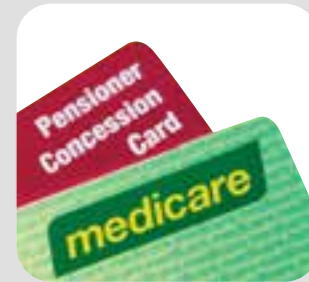
မက်ဒီကဲ/လျှော့ဈေးကတ်ပြား Medicare/concession card