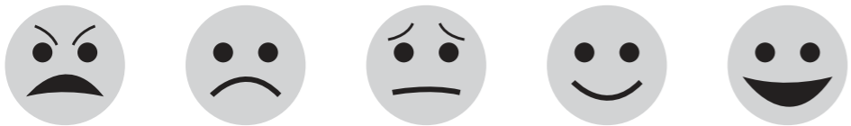
စိတ်ဆိုးနေသည် angry မပျော်ရွှင်ပါ unhappy စိုးရိမ်ပူပန်နေသည် worried ပျော်ရွှင်သည် happy စိတ်လှုပ်ရှားသည် excited