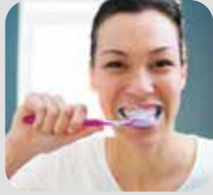
သွားတိုက် brush teeth