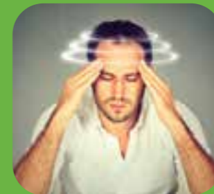
မူးဝေသည် dizzy