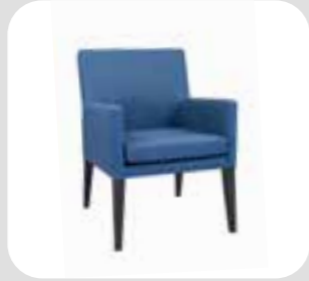
ကုလားထိုင် chair