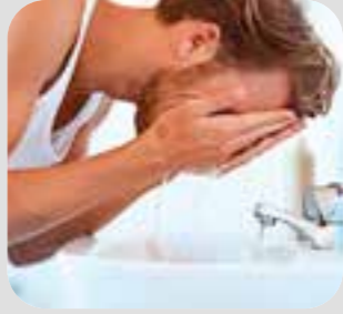
မျက်နှာသစ် wash