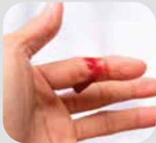
သွေးထွက်နေခြင်း bleeding