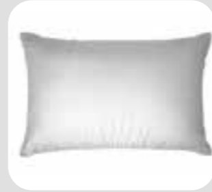
ခေါင်းအုံး pillow