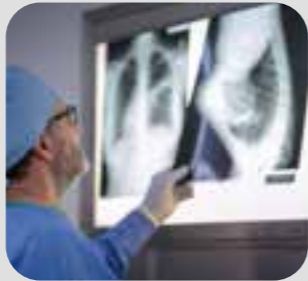
ဓါတ်မှန် x-ray