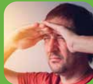
အလင်းရောင် လင်းလွန်းသည် too bright