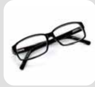
မျက်မှန် glasses