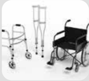
လှုပ်ရှားသွားလာရေး အကူပစ္စည်း mobility aid