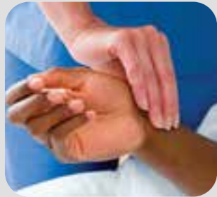
သွေးခုန်နှုန်း pulse