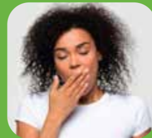
မောပန်းသည် tired