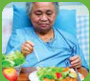
မိုက်ဆာသည် hungry