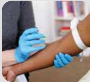
သွေးစစ်ဆေးခြင်း blood test