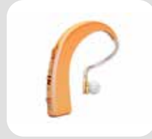
နားအကြား အကူပစ္စည်း hearing aid