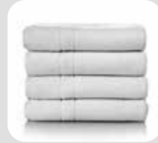
ကိုယ်သုတ်ပဝါ towel