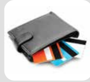
ပိုက်ဆံအိတ်/ပိုက်ဆံအိတ်ကလေး wallet/purse