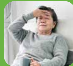
ခေါင်းကိုက်သည် headache