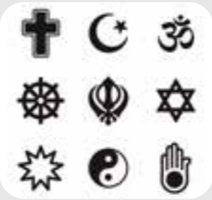
ဘာသာရေးဆိုင်ရာ ပံ့ပိုးမှု religious support