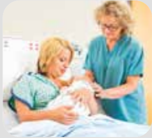
ဝမ်းဆွဲသူနာပြု midwife