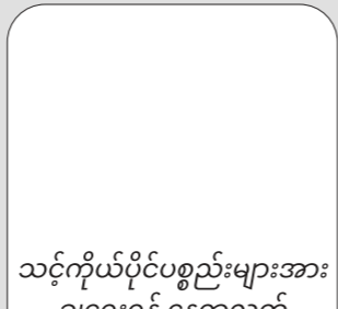
သင့်ကိုယ်ပိုင်ပစ္စည်းများအား ချရေးရန် နေရာလွတ် Free space to write your own items