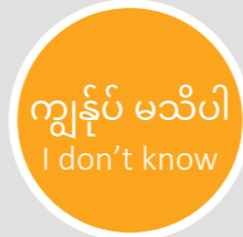
ကျွန်ုပ် မသိပါ I don't know