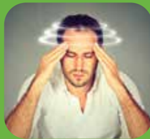
سرچرخ، گنس dizzy