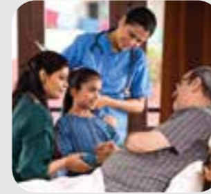
خانواده، فامیل family

اگر به ترجمان ضرورت دارید، به این عکس اشاره کنید و کارمندان یک ترجمان رایگان را برایتان تهیه می کنند When you need an interpreter, point to this picture and staff will provide you with one at no cost to you