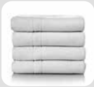
روی پاک، قدیفه towel