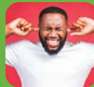
بیحد بلند too loud