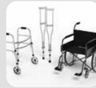
وسیله کمک برای حرکت کردن mobility aid