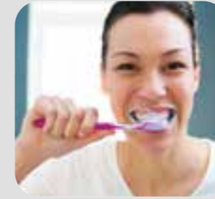
برس کردن دندانها brush teeth