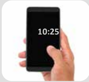
تلفون موبایل mobile phone