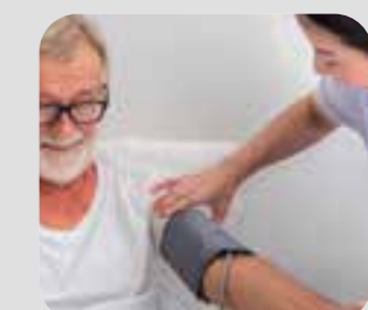
فشار خون blood pressure