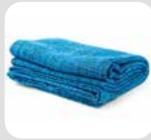
پتو، کمپل blanket