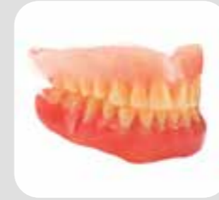
دندانهای مصنوعی dentures