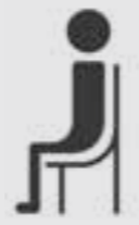
بنشینید sit up