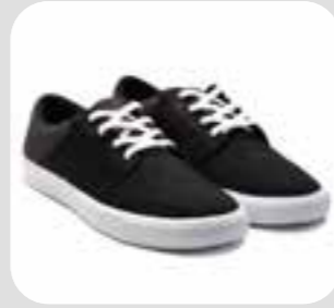
بوت ها shoes