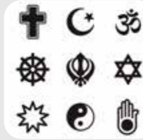
حمایت دینی religious support