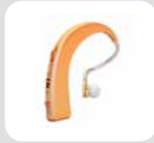
وسیله شنوایی hearing aid