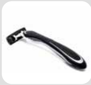
پل ریش، پاک razor