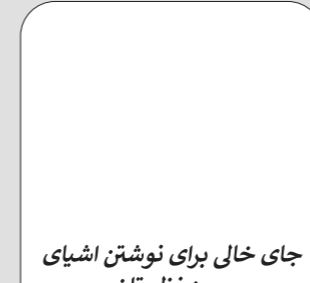
جای خالی برای نوشتن اشیای مورد نظر تان Free space to write your own items