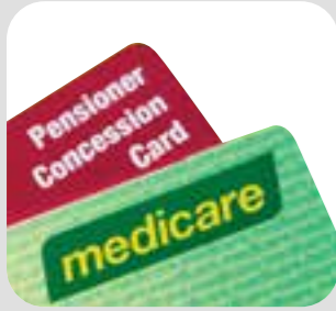
کارت مدیکر/ کارت تخفیف concession card/Medicare